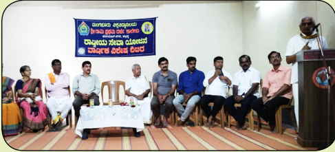
ರಾಷ್ಟ್ರೀಯ ಸೇವಾ ಯೋಜನೆಯ ವಾರ್ಷಿಕ ವಿಶೇಷ ಶಿಬಿರದ ಸಮಾರೋಪ 17.02.2024