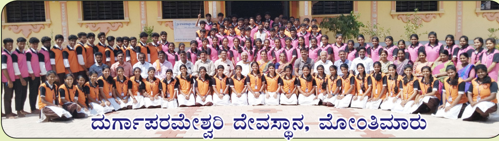
ದುರ್ಗಾಪರಮೇಶ್ವರಿ ದೇವಸ್ಥಾನ, ಮೋಂತಿಮಾರು

ರಾಷ್ಟ್ರೀಯ ಸೇವಾ ಯೋಜನೆಯ ವಾರ್ಷಿಕ ವಿಶೇಷ ಶಿಬಿರ 11.02.2024 – 17.02.2024