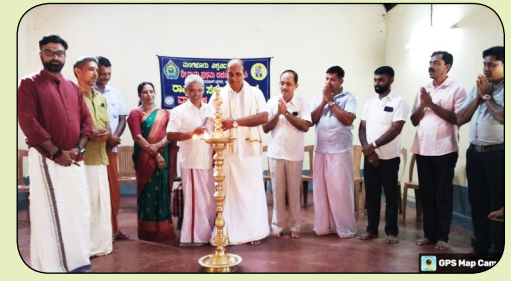
ರಾಷ್ಟ್ರೀಯ ಸೇವಾ ಯೋಜನೆ ವಾರ್ಷಿಕ ವಿಶೇಷ ಶಿಬಿರದ ಉದ್ಘಾಟನೆ 11.02.2024

ಸ್ವಾರ್ಥ ಸರಿಸಿ, ದೇಶ ಪ್ರೇಮ ಬೆಳೆಸಿ, ವ್ಯಕ್ತಿತ್ವ ವಿಕಸನವೇ ಶಿಬಿರದ ಮೂಲ ಉದ್ದೇಶ: