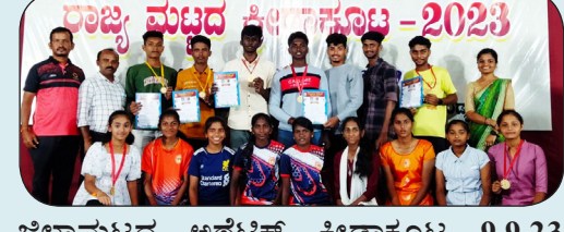
ಜಿಲ್ಲಾಮಟ್ಟದ ಅಥ್ಲೆಟಿಕ್ ಕ್ರೀಡಾಕೂಟ 9.9.23

ಶ್ರೀ ಮಾಧವ ವಿದ್ಯಾಲಯ ಕೆರೆಗೋಡು, ಮಂಡ್ಯದಲ್ಲಿ ನಡೆದ ವಿದ್ಯಾಭಾರತಿ ಕರ್ನಾಟಕ ರಾಜ್ಯ ಮಟ್ಟದ ಅಥ್ಲೆಟಿಕ್ ಕ್ರೀಡಾಕೂಟದಲ್ಲಿ ಏಳು ಮಂದಿ ವಿದ್ಯಾರ್ಥಿಗಳು ಪ್ರಥಮ ಸ್ಥಾನ ಮತ್ತು ಒಂಭತ್ತು ಮಂದಿ ದ್ವಿತೀಯ ಸ್ಥಾನ ಮತ್ತು ಮೂರು ಮಂದಿ ತೃತೀಯ ಸ್ಥಾನ ಪಡೆದಿರುತ್ತಾರೆ.