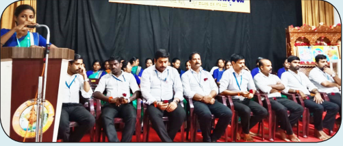
ಶಿಕ್ಷಕರ ದಿನಾಚರಣೆ 05.09.2023