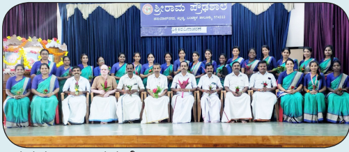
ಶಿಕ್ಷಕರ ದಿನಾಚರಣೆ 5.9.2023