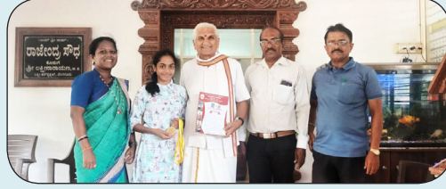
ಕ್ಷೇತ್ರೀಯ ಮಟ್ಟದ ಈಜು ಸ್ಪರ್ಧೆ 28.9.2023