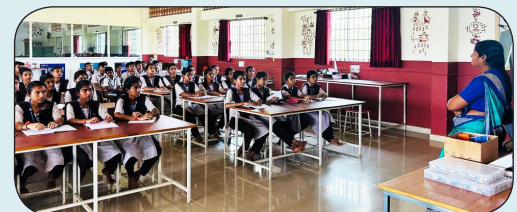
ಅಟಲ್ ಟೆಂಕರಿಂಗ್ ಲ್ಯಾಬ್‌ನಲ್ಲಿ ಕಾರ್ಯಾಗಾರ 4.9.23