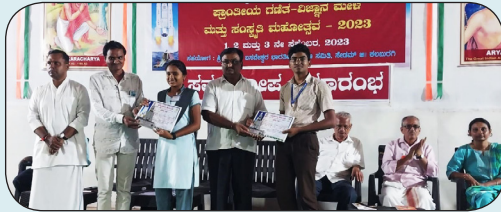
ಪ್ರಾಂತೀಯ ಗಣಿತ ವಿಜ್ಞಾನ ಮೇಳ 02.09.2023