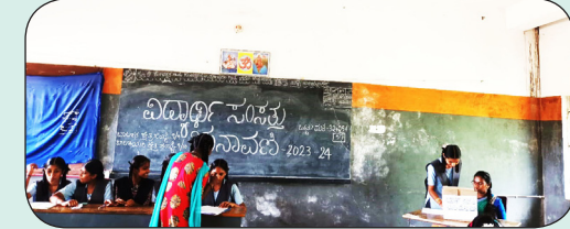
ಶಾಲಾ ಸಂಸತ್ತು ಚುನಾವಣೆ 1/07/2023

ತಾಲೂಕು ಮಟ್ಟದ ಕರಾಟೆ ಸ್ಪರ್ಧೆಯಲ್ಲಿ 17 ರ ವಯೋಮಾನದ ಬಾಲಕರ 40 ಕೆ.ಜಿ ವಿಭಾಗದಲ್ಲಿ ಧನುಷ್ 10ನೇ (ಚ್ಯವನ) ತೃತೀಯ ಸ್ಥಾನ ಹಾಗೂ 17 ರ ವಯೋಮಾನದ ಬಾಲಕಿಯರ 40 ಕೆಜಿ ವಿಭಾಗದಲ್ಲಿ ಉಮಾಭಾರತಿ 9ನೇ ಓಬವ್ವು ತೃತೀಯ ಸ್ಥಾನವನ್ನು ಪಡೆದುಕೊಂಡಿದ್ದಾರೆ.