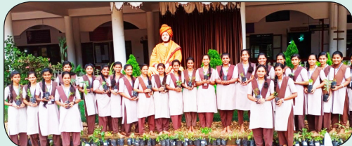
ಔಷಧೀಯ ಸಸ್ಯಗಳ ಸಂರಕ್ಷಣೆ 11.7.23

ಪದವಿಪೂರ್ವ ಕಾಲೇಜಿನಲ್ಲಿ ವಿವೇಕ ಸಂಜೀವಿನಿ ಪರಿಕಲ್ಪನೆಯಲ್ಲಿ ಔಷಧೀಯ ಸಸ್ಯಗಳ ಸಂರಕ್ಷಣೆಗೆ ಗಿಡಗಳ ತಯಾರಿ ಕಾರ್ಯಕ್ರಮ ನಡೆಸಲಾಯಿತು. ಬಾಳೆಲ ಗ್ರಾಮ ಪಂಚಾಯತ್ ಹಾಗೂ ವಿವಿಧ ಕಡೆಗಳಲ್ಲಿ ಗಿಡಗಳನ್ನು ನೆಟ್ಟು ಸಂರಕ್ಷಣೆ ಮಾಡಲಾಯಿತು.