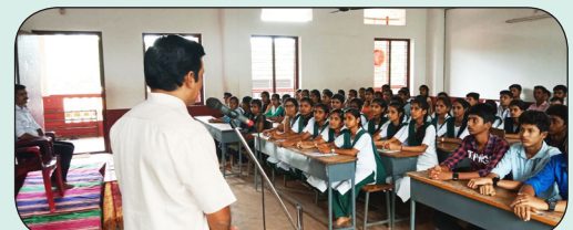
ಕಂಪೆನಿ ಸೆಕ್ರೆಟರಿ (CS) ತರಬೇತಿ 29.07.2023