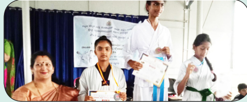
ಕರಾಟೆ ಸ್ಪರ್ಧೆಯಲ್ಲಿ ಭಾಗಿ 24.07.2023

ಪಿಲಿಕುಳದ ಪ್ರಾದೇಶಿಕ ವಿಜ್ಞಾನ ಕೇಂದ್ರದಲ್ಲಿ "ಅಂತರಾಷ್ಟ್ರೀಯ ಚಂದ್ರನ ದಿನ" ಎಂಬ ವಿಷಯದ ಕುರಿತು ದಕ್ಷಿಣ-ಕನ್ನಡ ATL ವತಿಯಿಂದ ನಡೆದ ಕಾರ್ಯಾಗಾರದಲ್ಲಿ 4 ವಿದ್ಯಾರ್ಥಿಗಳು ಹಾಗೂ 2 ಶಿಕ್ಷಕಿಯರು ಭಾಗವಹಿಸಿದ್ದರು