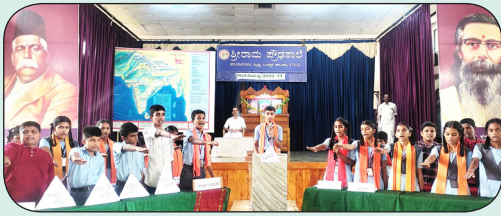
ಶಾಲಾ ಸಂಸತ್ತು ಉದ್ಘಾಟನೆ 8.7.2023

2023-24ನೇ ಸಾಲಿನ ಶೈಕ್ಷಣಿಕ ವರ್ಷದ ಶಾಲಾ ಸಂಸತನ್ನು ಮುಖ್ಯೋಪಾಧ್ಯಾಯರು ದೀಪ ಬೆಳಗಿಸಿ, ಸಭಾಪತಿಗಳಿಗೆ ಪ್ರಮಾಣ ವಚನ ಬೋಧಿಸಿದರು. ಸಭಾಪತಿಗಳು ಆಡಳಿತ ಪಕ್ಷದ ಎಲ್ಲಾ ಮಂತ್ರಿಗಳಿಗೆ ಪ್ರಮಾಣ ವಚನ ಬೋಧಿಸಿದರು.