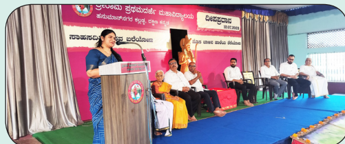
ಮಂಥನ-ಏಕರೂಪ ನಾಗರಿಕ ಸಂಹಿತೆ 28.7.23