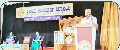
ವಿದ್ಯಾರ್ಥಿ ಸಂಘ ಉದ್ಘಾಟನೆ 10.07.2023

ಪದವಿಪೂರ್ವ ಕಾಲೇಜಿನಲ್ಲಿ ವಿವೇಕ ಸಂಜೀವಿನಿ ಪರಿಕಲ್ಪನೆಯಲ್ಲಿ ಔಷಧೀಯ ಸಸ್ಯಗಳ ಸಂರಕ್ಷಣೆಗೆ ಗಿಡಗಳ ತಯಾರಿ ಕಾರ್ಯಕ್ರಮ ನಡೆಸಲಾಯಿತು. ಬಾಳೆಲ ಗ್ರಾಮ ಪಂಚಾಯತ್ ಹಾಗೂ ವಿವಿಧ ಕಡೆಗಳಲ್ಲಿ ಗಿಡಗಳನ್ನು ನೆಟ್ಟು ಸಂರಕ್ಷಣೆ ಮಾಡಲಾಯಿತು.