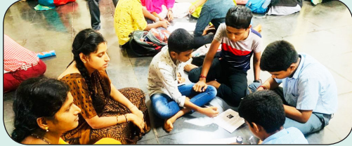
"ಅಂತರಾಷ್ಟ್ರೀಯ ಚಂದ್ರನ ದಿನ" ವಿಷಯದ ಕಾರ್ಯಾಗಾರದಲ್ಲಿ ಭಾಗಿ 20.07.2023