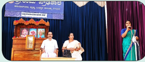
8ನೇ ತರಗತಿ ವಿದ್ಯಾರ್ಥಿಗಳ ಪೋಷಕರ "ಆಪ್ತ-ಸಮಾಲೋಚನಾ ಸಭೆ" 12.7.2023

2023-24ನೇ ಸಾಲಿನ ಶೈಕ್ಷಣಿಕ ವರ್ಷದ ಶಾಲಾ ಸಂಸತನ್ನು ಮುಖ್ಯೋಪಾಧ್ಯಾಯರು ದೀಪ ಬೆಳಗಿಸಿ, ಸಭಾಪತಿಗಳಿಗೆ ಪ್ರಮಾಣ ವಚನ ಬೋಧಿಸಿದರು. ಸಭಾಪತಿಗಳು ಆಡಳಿತ ಪಕ್ಷದ ಎಲ್ಲಾ ಮಂತ್ರಿಗಳಿಗೆ ಪ್ರಮಾಣ ವಚನ ಬೋಧಿಸಿದರು.