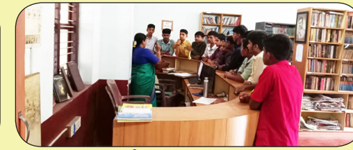
ಗ್ರಂಥಾಲಯದ ಭೇಟಿ 15.06.2023