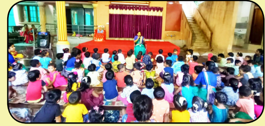
ಸಾಮೂಹಿಕ ಹುಟ್ಟುಹಬ್ಬ 30.6.23

ವಿಶ್ವ ಯೋಗ ದಿನಾಚರಣೆಯ ಪ್ರಯುಕ್ತ ಶ್ರೀರಾಮ ಶಿಶುಮಂದಿರ, ಅಕ್ಕಮಹಾದೇವಿ ಶಿಶುಮಂದಿರ, ಶ್ರೀಕೃಷ್ಣ, ಶ್ರೀಗಣೇಶ ಮತ್ತು ಸರಸ್ವತಿ ಶಿಶುಮಂದಿರಗಳಲ್ಲಿ ಯೋಗ ಅಭ್ಯಾಸ ಮಾಡಿಸಲಾಯಿತು.