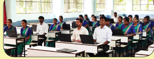
Faculty Development Program on AI ಶಿಕ್ಷಕರ ತರಬೇತಿ ಕಾರ್ಯಾಗಾರ 26.6.23

ವಿವೇಕಾನಂದ ಕಾನೂನು ಮಹಾವಿದ್ಯಾಲಯ ಪುತ್ತೂರಿನ ಪ್ರಾಧ್ಯಾಪಕರು ಹಾಗೂ ಕಾನೂನು ವಿದ್ಯಾರ್ಥಿಗಳು ನ್ಯಾಯಾಲಯದ ಕೆಲಸದ ಪ್ರಾತ್ಯಕ್ಷಿಕೆಯನ್ನು ತೋರಿಸಿದರು. ವಿದ್ಯಾರ್ಥಿಗಳು ಹಾಗೂ ಉಪನ್ಯಾಸಕರು ಉಪಸ್ಥಿತರಿದ್ದರು.