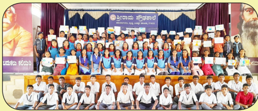
ವಿಶ್ವ-ಪರಿಸರ ದಿನಾಚರಣೆ 5.6.2023