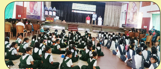
ವಿವಿಧ ಕಲಾಪ್ರಕಾರಗಳ ಉದ್ಘಾಟನೆ

ವಿಜ್ಞಾನ ಮಾದರಿ ಪ್ರದರ್ಶನವನ್ನು ಶಿಶುವರ್ಗದವರಿಗೆ ದಧೀಚಿ ತರಗತಿಯಲ್ಲಿ, ಬಾಲವರ್ಗದವರಿಗೆ ಕೌಸಲ್ಯ ತರತಿಯಲ್ಲಿ ಹಾಗೂ ಗಣಿತ ಮಾದರಿ ಪ್ರದರ್ಶನವನ್ನು ವಿಜ್ಞಾನ ಪ್ರಯೋಗಾಲಯದಲ್ಲಿ ಹಮ್ಮಿಕೊಳ್ಳಲಾಯಿತು.