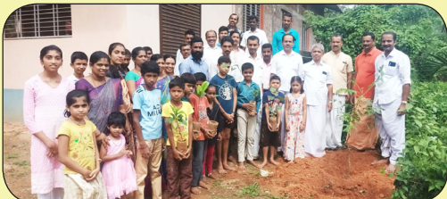
ಗ್ರಾಮದಲ್ಲಿ ವಿವೇಕ ಸಂಜೀವಿನಿ : 25.6.2023