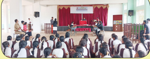
ನ್ಯಾಯಾಲಯದ ಪ್ರಾತ್ಯಕ್ಷಿಕೆ 09.06.2023

ವಾಣಿಜ್ಯ ವಿಭಾಗದ 26 ವಿದ್ಯಾರ್ಥಿಗಳು ಪುತ್ತೂರಿನ ಅಕ್ಷಯ ಕಾಲೇಜಿನಲ್ಲಿ ನಡೆದ ಫೆಸ್ಟಿನಲ್ಲಿ ಭಾಗವಹಿಸಿ 31 ಕಾಲೇಜುಗಳ ಜೊತೆ ಸ್ಪರ್ಧಿಸಿ ಸಮಗ್ರ ಪ್ರಶಸ್ತಿ ಪಡೆದಿರುತ್ತಾರೆ.