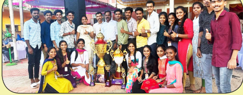
Commerce and Design Fest ನಲ್ಲಿ ಸಮಗ್ರ ಪ್ರಶಸ್ತಿ 08.06.2023

ವಾಣಿಜ್ಯ ವಿಭಾಗದ 26 ವಿದ್ಯಾರ್ಥಿಗಳು ಪುತ್ತೂರಿನ ಅಕ್ಷಯ ಕಾಲೇಜಿನಲ್ಲಿ ನಡೆದ ಫೆಸ್ಟಿನಲ್ಲಿ ಭಾಗವಹಿಸಿ 31 ಕಾಲೇಜುಗಳ ಜೊತೆ ಸ್ಪರ್ಧಿಸಿ ಸಮಗ್ರ ಪ್ರಶಸ್ತಿ ಪಡೆದಿರುತ್ತಾರೆ.