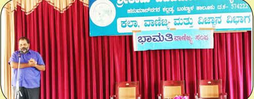
ಕಂಪನಿ ಸೆಕ್ರೆಟರಿ ಕಾರ್ಯಾಗಾರ 23.6.2023