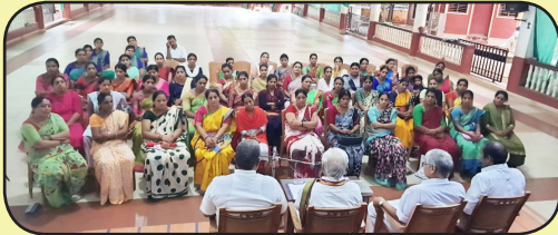
ಮಾತೃಭಾರತಿ ಬೈರಕ್, ಯೋಗಾಸನ : 21.6.23

ಉತ್ತಮ ನಾಯಕನ ಆಯ್ಕೆ, ಮತದಾನ, ಪ್ರಜಾಪ್ರಭುತ್ವದ ಮಹತ್ವ ಹಾಗೂ ಚುನಾವಣೆ ಪ್ರಕ್ರಿಯೆಯನ್ನು ತಿಳಿಸುವ ನಿಟ್ಟಿನಲ್ಲಿ ಶಾಲಾ ಚುನಾವಣೆಯು ನಡೆಯಿತು. ಮೊಬೈಲ್ ಇ.ವಿ.ಎಂ ಆಪ್ ಮೂಲಕ ಮತದಾನ ನಡೆಸಲಾಯಿತು.