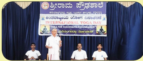
ಅಂತರಾಷ್ಟ್ರೀಯ ಯೋಗ ದಿನಾಚರಣೆ 21.06.23

ಎನ್.ಸಿ.ಸಿ ಹಾಗೂ ಸೌಟ್ ಗೈಡ್ ತಂಡದ ವಿದ್ಯಾರ್ಥಿಗಳು ಗಿಡ ನೆಟ್ಟು ಸುತ್ತಮುತ್ತಲಿನ ಪರಿಸರವನ್ನು ಸ್ವಚ್ಛಗೊಳಿಸಿದರು. ಚಿತ್ರಕಲಾ ಸರ್ಧ ನೆರವೇರಿತು, ಭೂಷಣ್ ಪರಿಸರದ ಬಗ್ಗೆ ವೆವರಿಸಿದನು. ನಿನಾದ್ ನಿರೂಪಿಸಿದನು.