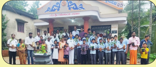
ಔಷಧಿಯ ವನ ನಿರ್ಮಾಣ ಹಾಗೂ ಸಸಿ ವಿತರಣಾ ಕಾರ್ಯಕ್ರಮ 29.06.2023