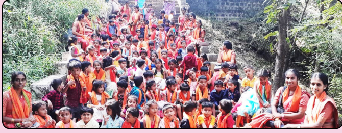
ಹೊರಸಂಚಾರ 10.11.2022: ಕಾರಿಂಜೇಶ್ವರ ದೇವಸ್ಥಾನ, ಸಾಲು ಮರದ ತಿಮ್ಮಕ್ಕ ಉದ್ಯಾನವನ, ಮತ್ತು ಬಿ.ಸಿ.ರೋಡ್ ರೈಲ್ವೆ ನಿಲ್ದಾಣ. 120 ಮಕ್ಕಳು, 3 ಮಂದಿ ಅಭಿವೃದ್ಧಿ ಸಮಿತಿ ಸದಸ್ಯರು ಭಾಗಿ.