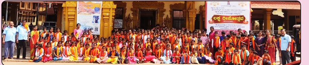
4ನೇ ತರಗತಿ ಪ್ರವಾಸ 10.11.2022: ಉಜ್ಜಿಲ ಮಹಾಲಕ್ಷ್ಮೀ ದೇವಸ್ಥಾನ, ಬಪ್ಪನಾಡು ಪರಮೇಶ್ವರಿ ದೇವಸ್ಥಾನ ಹಾಗೂ ಪಣಂಬೂರು ಕಡಲತೀರಕ್ಕೆ ಆಯೋಜಿಸಲಾಗಿತ್ತು. 168 ವಿದ್ಯಾರ್ಥಿಗಳು ಹಾಗೂ 8 ಅಧ್ಯಾಪಕರು ಈ ಪ್ರವಾಸದಲ್ಲಿ ಪಾಲ್ಗೊಂಡಿದ್ದರು.