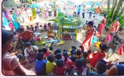
ಉತ್ಥಾನ ದ್ವಾದಶಿಯಂದು ವಿವಿಧ ಶಿಶುಮಂದಿರಗಳಲ್ಲಿ ತುಳಸಿ ಪೂಜೆ ಹಾಗೂ ಗೋಪೂಜೆ ಕಾರ್ಯಕ್ರಮಗಳು ನಡೆದಿದ್ದು, ಪಾಲಕರು ಹಾಗೂ ಪುಟಾಣಿಗಳು ಭಾಗವಹಿಸಿದ್ದರು. ಶಿಶುಗಳು ಗೋವುಗಳಿಗೆ ಗೋಗ್ರಾಸ ನೀಡಿ ಸಂಭ್ರಮಿಸಿದರು.