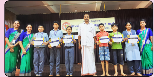
ತಾಲೂಕು ಮಟ್ಟದ ಪ್ರತಿಭಾ ಕಾರಂಜಿ : 3.11.2022 ಎಸ್.ವಿ.ಎಸ್ ದೇವಳ ಆಂಗ್ಲಮಾಧ್ಯಮ ಶಾಲೆ, ಬಂಟ್ವಾಳ ಇಲ್ಲಿ ನಡೆದ ತಾಲೂಕು ಮಟ್ಟದ ಪ್ರತಿಭಾ ಕಾರಂಜಿಯಲ್ಲಿ ಶ್ರೀರಾಮ ಪ್ರಾ. ಶಾಲೆಯ ವಿದ್ಯಾರ್ಥಿಗಳು ಭಾಗವಹಿಸಿ, 3 ಪ್ರಥಮ, 2 ದ್ವಿತೀಯ, ಹಾಗೂ 1 ತೃತೀಯ ಸ್ಥಾನ ಪಡೆದಿರುತ್ತಾರೆ.