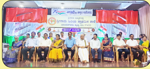
ಕಾರ್ಗಿಲ್ ಸಂಸ್ಕರಣೆ : 26.7.2022

ವಿಟ್ಟಿ ಸಮುದಾಯ ಕೇಂದ್ರದ ವತಿಯಿಂದ ರಾಷ್ಟ್ರೀಯ ಕಿಶೋರ ಸ್ವಾಸ್ಥ್ಯ ಕಾರ್ಯಕ್ರಮದಡಿಯಲ್ಲಿ ವಿದ್ಯಾರ್ಥಿನಿಯರಿಗೆ ನಡೆದ ಆರೋಗ್ಯ ಮಾಹಿತಿ ತಿಬಿರ.