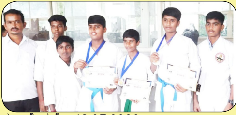
ಕರಾಟೆ ಸ್ಪರ್ಧೆ 18.07.2022