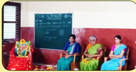
ಗುರುಪೂಜಾ ಕಾರ್ಯಕ್ರಮ 18.07.2022

ಶ್ರೀರಾಮ ಶಿಶುಮಂದಿರದ ಎಲ್ಲಾ ಮಾತಾಜಿಗಳಿಗೆ ದೈನಂದಿನ ಚಟುವಟಿಕೆಯ ಅಭ್ಯಾಸ ಕಾರ್ಯಾಗಾರ ನಡೆಸಲಾಯಿತು. ಪ್ರತಿನಿತ್ಯ ಹೇಳುವ ನೈಮಿತ್ತಿಕ ಶ್ಲೋಕ, ಪಂಚಾಂಗಗಳನ್ನು ಪರಿಚಯಿಸಲಾಯಿತು.