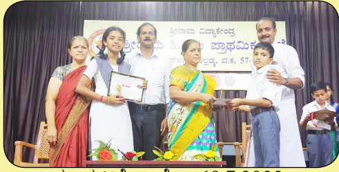
ತಾಲೂಕು ಮಟ್ಟಕ್ಕೆ ಆಯ್ಕೆ : 19.7.2022