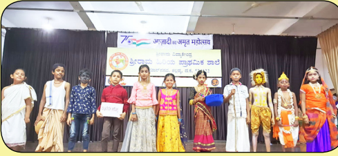
ಶಾಲಾ ಮಟ್ಟದ ಪ್ರತಿಭಾ ಕಾರಂಚಿ : 30.7.2022

ಕಾರ್ಗಿಲ್ ವಿಜಯೋತ್ಸವದ ದಿನವನ್ನು ನಿವೃತ್ತ ಆ ಸೈನಿಕರೊಂದಿಗೆ ಆಚರಿಸಲಾಯಿತು. ಆ ದಿನದಂದು ವಿಶೇಷವಾಗಿ ಸೈನಿಕ ದಂಪತಿಗಳನ್ನು ಆಹ್ವಾನಿಸಲಾಗಿತ್ತು. ಅವರೆಲ್ಲರಿಗೂ ಗೌರವ ಸಮರ್ಪಣೆ ಮಾಡಲಾಯಿತು.