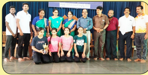
ವಲಯ ಮಟ್ಟದ ಶಟಲ್ ಬ್ಯಾಡ್ಮಿಂಟನ್ 12.07.2022

14 ಮತ್ತು 17ರ ವಯೋಮಾನದ ವಲಯ ಮಟ್ಟದ ಶಟಲ್ ಬ್ಯಾಡ್ಮಿಂಟನ್ ಪೌಢಶಾಲಾ ಬಾಲಕರ ವಿಭಾಗದಲ್ಲಿ ಶ್ರೀರಾಮ ಪೌಢಶಾಲೆಯ ದ್ವಿತೀಯ ಹಾಗೂ ಬಾಲಕಿಯರ ವಿಭಾಗದಲ್ಲಿ ಪ್ರಥಮ ಸ್ಥಾನ ಪಡೆದುಕೊಂಡಿದೆ.