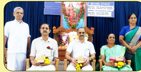
ಗುರುವಂದನ ಕಾರ್ಯಕ್ರಮ 13/02/2022

14 ಮತ್ತು 17ರ ವಯೋಮಾನದ ವಲಯ ಮಟ್ಟದ ಶಟಲ್ ಬ್ಯಾಡ್ಮಿಂಟನ್ ಪೌಢಶಾಲಾ ಬಾಲಕರ ವಿಭಾಗದಲ್ಲಿ ಶ್ರೀರಾಮ ಪೌಢಶಾಲೆಯ ದ್ವಿತೀಯ ಹಾಗೂ ಬಾಲಕಿಯರ ವಿಭಾಗದಲ್ಲಿ ಪ್ರಥಮ ಸ್ಥಾನ ಪಡೆದುಕೊಂಡಿದೆ.