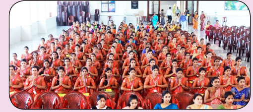
ವಿದ್ಯಾಭಾರತಿ ಶೈಕ್ಷಣಿಕ ಸಹಮಿಲನದಲ್ಲಿ ಭಾಗಿ

ಭದ್ರವೇಷ, ಮಣ್ಣಿನ ಮಾದರಿ ತಯಾರಿ, ಹಾಸ್ಯ, ಚಿತ್ರಕಲೆ, ಕಂಠಪಾಠ, ಭಾಷಣ, ಭಗ್ಗೀತೆ, ಧಾರ್ಮಿಕ ಪಠಣ, ಅಭಿನಯ ಗೀತೆ, ಲಘುಸಂಗೀತ ಇತ್ಯಾದಿ ಸ್ಪರ್ಧೆಗಳನ್ನು ಆಯೋಜಿಸಲಾಯಿತು.