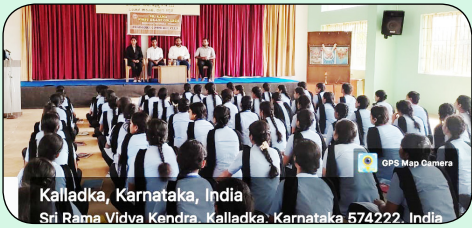
Kalladka, Karnataka, India Sri Rama Vidya Kendra, Kalladka, Karnataka 574222, India