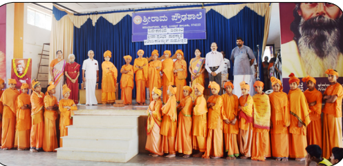
ವಿವೇಕಾರ್ಚನೆ - ಪ.ಪೂ ವಿಭಾಗ