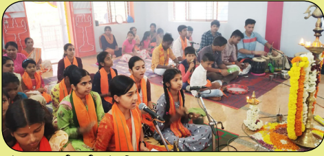
ಭಜನಾ ಸೇವೆಯಲ್ಲಿ ಭಾಗಿ 25.12.21