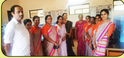
ಪ್ರಯೋಗಾಲಯ ವೀಕ್ಷಣೆ 2.12.21

ಬಾಳ್ವಿಲ ಪ್ರಾಥಮಿಕ ಆರೋಗ್ಯ ಕೇಂದ್ರದವರು ಪೌಢಶಾಲೆಯ ಎಲ್ಲಾ ವಿದ್ಯಾರ್ಥಿಗಳಿಗೆ ಆರೋಗ್ಯ ತಪಾಸಣೆ ಮಾಡಿ 10ನೇ ತರಗತಿಯ ವಿದ್ಯಾರ್ಥಿಗಳಿಗೆ ಟಿ.ಟಿ ಇಂಜೆಕ್ಷನ್ ನೀಡಿದರು.