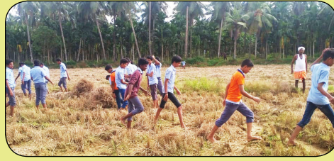
ವಸುಧಾರಾ ಗೋಶಾಲೆಗೆ ಮೇವು 3.12.21