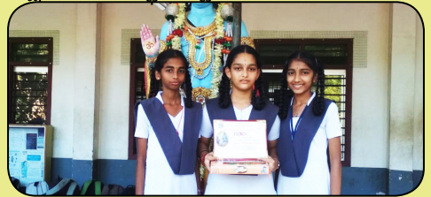
ಭಗವದ್ಗೀತಾ ಕಂಠಪಾಠ - ಪ್ರಥಮ 20.12.21

ಪೌಢಶಾಲೆಯ ಎಲ್ಲಾ ವಿಜ್ಞಾನ ಅಧ್ಯಾಪಕರು ಹಾಗೂ ಮುಖ್ಯೋಪಾಧ್ಯಾಯರು ಪುತ್ತೂರಿನ ವಿವೇಕಾನಂದ ಸಿಬಿಎಸ್ಸಿ ಶಾಲೆಯ ವಿಜ್ಞಾನ ಪ್ರಯೋಗಾಲಯವನ್ನು ವೀಕ್ಷಣೆ ಮಾಡಿದರು.