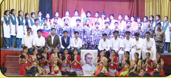
ಸಾಂಸ್ಕೃತಿಕ ಕಾರ್ಯಕ್ರಮ 31.12.21: