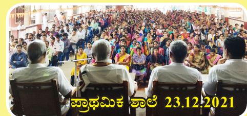
ಪ್ರಾಥಮಿಕ ಶಾಲೆ 23.12.2021