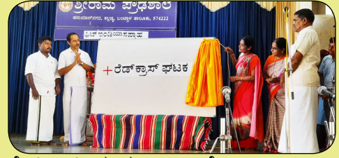
ರೆಡ್ ಕ್ರಾಸ್ ಘಟಕ ಉದ್ಘಾಟನೆ

ವಿದ್ಯಾಕೇಂದ್ರದದಲ್ಲಿರುವ ಗೋವುಗಳಿಗೆ ಮೇವು ಸಂಗ್ರಹಿಸುವ ನಿಟ್ಟಿನಲ್ಲಿ ಪೌಢಶಾಲಾ ವಿದ್ಯಾರ್ಥಿಗಳು ಸುದ್ದೆಕಾರ್ನಲ್ಲಿ ಭತ್ತ ಬೆಳೆದ ಹೊಲದಿಂದ ಹುಲ್ಲನ್ನು ಸಂಗ್ರಹಿಸಿ ಗೋಶಾಲೆಗೆ ನೀಡಿದರು.