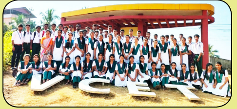
ವಿವೇಕಾನಂದ ಇಂಜಿನಿಯರಿಂಗ್ ಕಾಲೇಜು ಭೇಟಿ. 22.12.21